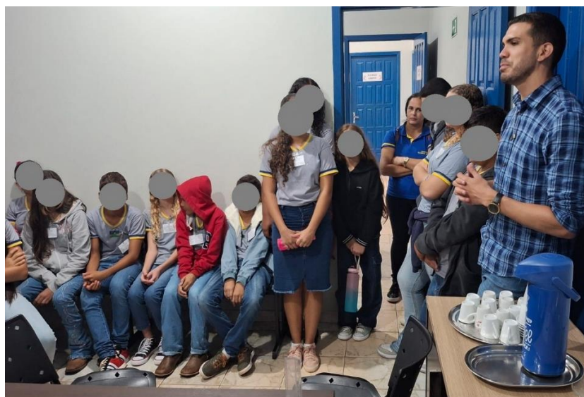
Foto 02 – Prefeito Lucas Nunes – Município de Primavera de Rondônia recebendo os alunos no gabinete da prefeitura.

No que se refere ao objetivo de compreender a gestão pública, a atividade possibilitou aprofundar o entendimento acerca das responsabilidades do chefe do Executivo Municipal, especialmente no tocante à condução administrativa, à execução das leis aprovadas pelo Legislativo e à formulação de políticas públicas voltadas ao interesse coletivo. O prefeito, enquanto agente político e autoridade máxima do Executivo local, exerce funções de planejamento, coordenação e controle da máquina administrativa, sendo responsável pela gestão dos recursos públicos e pela efetivação das ações governamentais previstas no plano de governo e no orçamento público (MEIRELLES, 2016). A interação institucional observada entre vereadores e representantes do Executivo evidenciou, ainda, o papel fiscalizador da Câmara Municipal, fundamental para assegurar a legalidade, a eficiência e a transparência da administração pública.