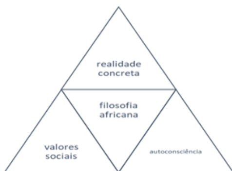
Figura 01- O sujeito na filosofia africana

lógica típica da filosofia africana, conforme Lopes (2021) e a típica da BNCC. A figura 1 mostra como a lógica da filosofia africana coloca a comunidade como acima do indivíduo e como postula a autoconsciência. A BNCC, por meio da lógica das competências e habilidades, retira do sujeito a contextualização necessária para agir de forma reflexiva diante da sua história