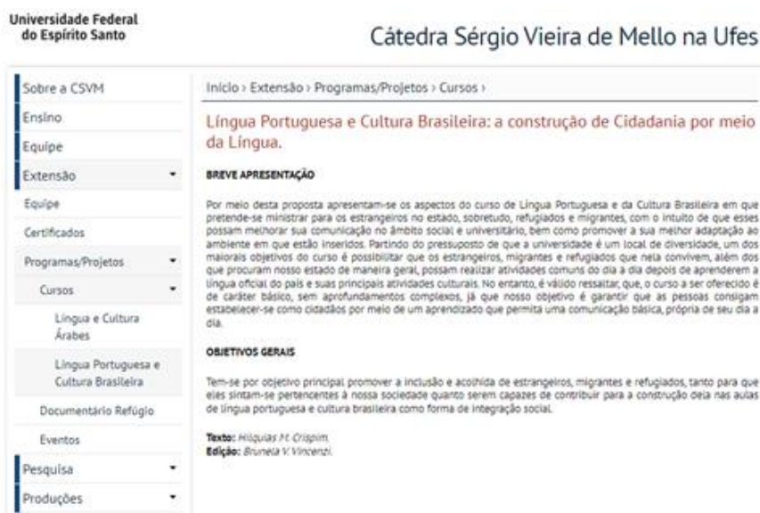
Figura 3 - Demonstrativo de projeto de extensão

No caso da CSVM-UFES, as atividades foram iniciadas com o projeto denominado “Língua e Cultura Árabes: a construção de Cidadania por meio da Língua”, visando “ministrar aulas gratuitas de língua e cultura árabes para membros da comunidade interna e externa da Universidade” (SALA et al. apud VINCENZI et. al., 2018, p. 42). No ano de 2017, a Cátedra Sérgio Vieira de Mello, em parceria com o Departamento de Línguas e Letras da UFES, deu início ao projeto de extensão “Língua Portuguesa e Cultura Brasileira: a construção de Cidadania por meio da Língua” 3 , com o objetivo de promover a inclusão de estrangeiros/as, imigrantes e refugiados/as, tanto para que eles/as sintam-se pertencentes à nossa sociedade quanto para se sentirem capazes de contribuir para a construção nas aulas de língua portuguesa e na cultura brasileira, conforme demonstra a imagem abaixo: