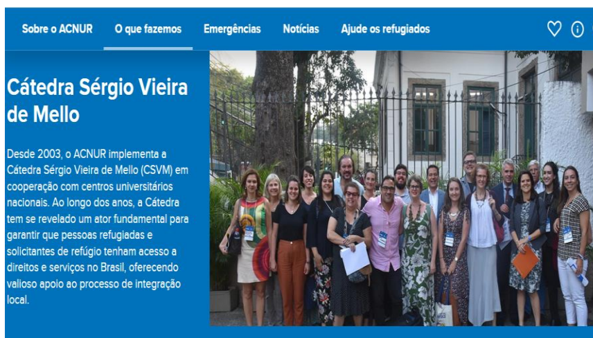
Figura 2 - Cátedra Sérgio Vieira de Mello

Criada em 2003 2 , a Cátedra Sérgio Vieira de Mello, tem como objetivo ampliar o acesso e serviços a pessoas refugiadas e imigrantes no Brasil, além de promover o ensino da língua portuguesa como estratégia de acolhimento e inclusão. Atualmente conta com a participação de diversas universidades brasileiras (aproximadamente 43 instituições), dentre as quais se destacam a Universidade de Brasília, a Universidade Estadual do Rio de Janeiro e a Universidade Federal da Bahia.