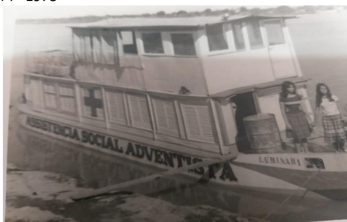
Figura 3: Luminar I - 1978