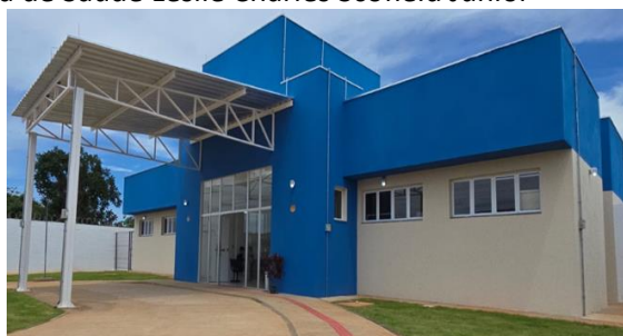
Figura 6: Unidade Básica de Saúde Leslie Charles Scofield Junior